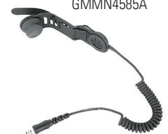
Savox HC-1 GMMN4585A

Das Savox HC-1 ist eine kompakte Helm-Kommunikationseinheit für Profis, welche unter gefährlichen Bedingungen arbeiten müssen. Sie lässt sich leicht in fast alle Helmtypen integrieren und bietet eine klare Freisprechverbindung, die ideal für Feuerwehrmänner und Rettungskräfte geeignet ist.