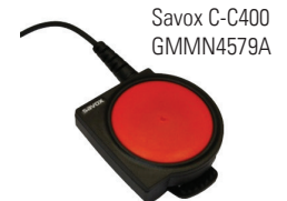
Savox C-C400 GMMN4579A

Vervollständigt wird diese Lösung durch das Savox C-C400 , das die Benutzung Ihres Zweivegefunkgeräts auch in gefährlichen Situationen ermöglicht . Die robuste und speziell für extreme Umgebungen entwickelte extra große PTT-Taste sorgt für eine zuverlässige Bedienung, auch unter Arbeits- und Schutzkleidung.