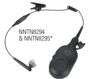
NNTN8294 & NNTN8295*

Die im Funkgerät integrierte Bluetooth 2.1 Audiofunktion ermöglicht eine schnelle und sichere Verbindung mit einer Vielzahl von Bluetooth-Zubehörteilen. Die einfach zu verbindenden Motorola Bluetooth-Zubehörteile verbessern die Leistung und Sicherheit Ihrer Mitarbeiter, wenn diese diskret und verdeckt arbeiten und sich ohne störende Anschlussleitungen fortbewegen müssen. Ein ganz neues Benutzergefühl wartet auf Sie.